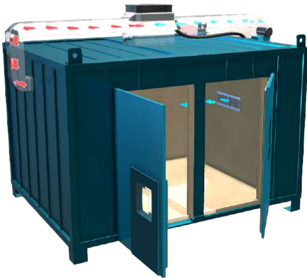
Vista de flujo