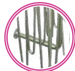
Soporte a Pared